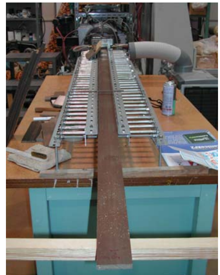
写真 1 押し出し成形による竹粉プラスチック複合体の製造

香川県産業技術センターにあるコニカルタイプの二軸式押し出し成形機を用い、シリンダおよび金型の温度を竹粉 80 部での成形では 180°C に、竹粉 60 部での成形では 165°C に設定して、幅 60mm、厚さ 10mm の形状の成型体を作製した(写真 1)。いずれの配合比でも押し出し成形は十分可能であり、金型内部の圧力が 10MPa 程度の時、最も良好な成型物が得られた。