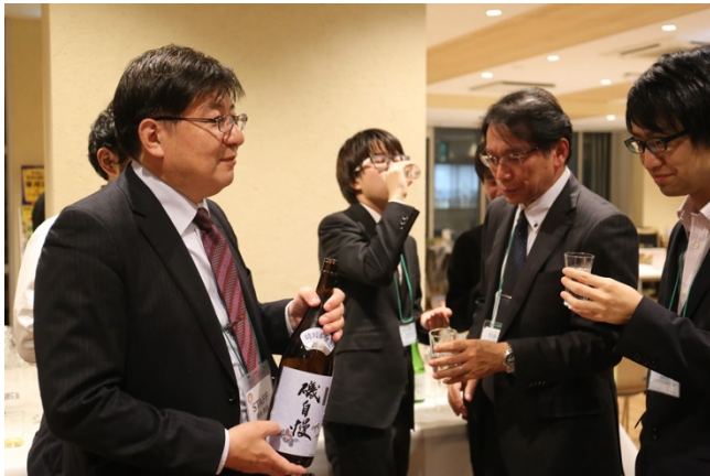
懇親会での一場面