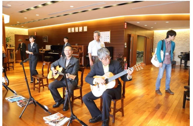
見学会（ハーモニープラザ）での一場面