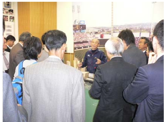
写真2. 久保田プロバットマイスターによる実演とミニ講演