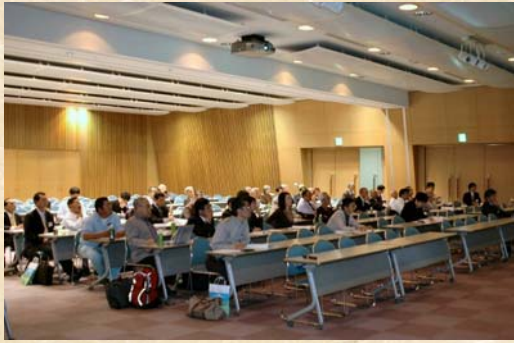
シンポジウム会場