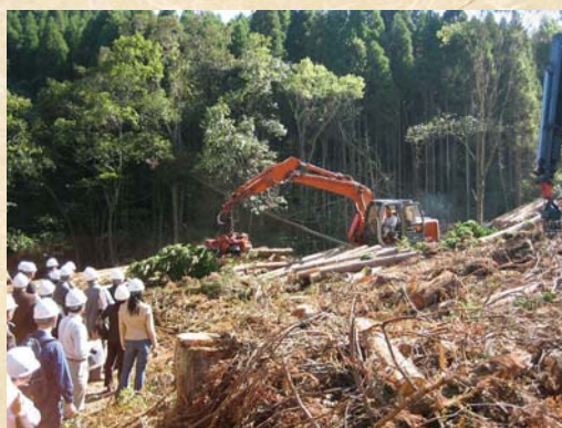
高性能林業機械デモ