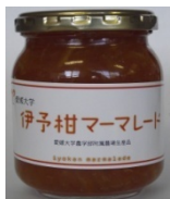
『伊予柑 マーマレード』

愛媛で有名な辛口のお酒・小富士を作る島田酒造さんにお作りいただきました。使用した米は、愛大附属農場で作った「安心米」のみを使用。辛口ですがフルーティな喉ごしは、冷酒でも常温でもお楽しみただけ、料理の邪魔をしない美味しいお酒に仕上がっています。