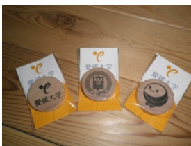
『オリジナル 木製マグネット』